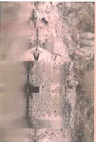
LE MOULIN ENGLOUTI DE SAINT-JUST

Construit sur la Rance entre usine hydroélectrique d'une puissance Plouasne et Guenroc, le barrage de cinq mégawatts. Appelé Rocheemel a été mis en eau en 1937. Prévu pour alimenter partiellement en eau la ville de Rennes, cet ouvrage est aussi une terre noble où coulait la Rance le long des coteaux de Guenroc. Aujourd'hui, ces coteaux surplombent la retenue pour aboutir ensuite au sentier des mégalithes. Le château de Beaumont que vous apercevrez dès votre départ de Guitté date du XVII e siècle. Propriété privée, il ne peut être visité, mais son portail du XV e siècle mérite un arrêt.