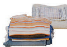
Textiles (linge de maison, vêtements, chaussures)