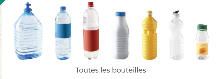
Toutes les bouteilles