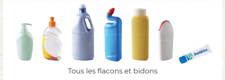
Tous les flacons et bidons