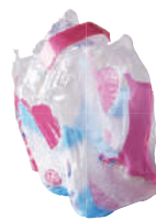
Tous les autres emballages en plastique