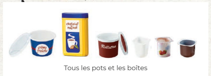
Tous les pots et les boîtes