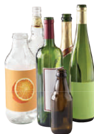
Bouteilles en verre