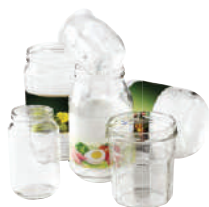
Pots et bocaux en verre