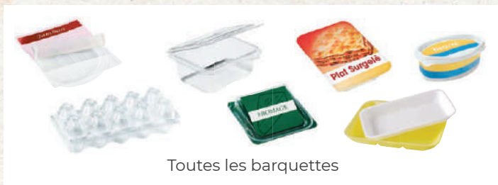
Toutes les barquettes