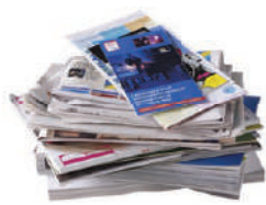
Tous les papiers (séparés de leur emballage plastique)