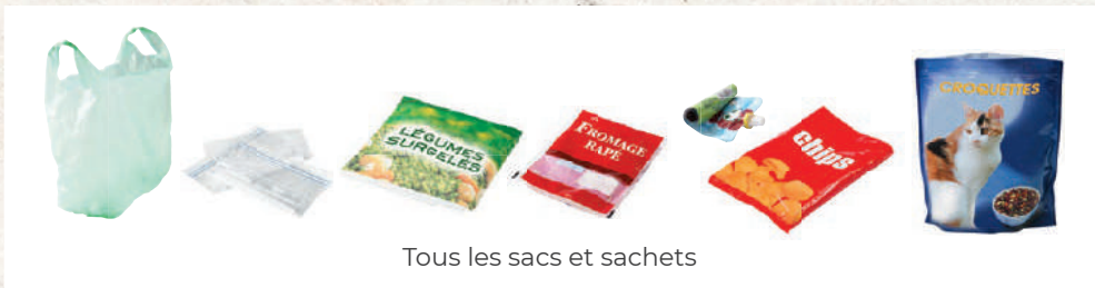
Tous les sacs et sachets