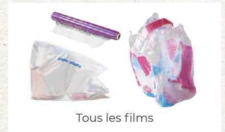
Tous les films