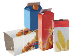
Briques et emballages en carton